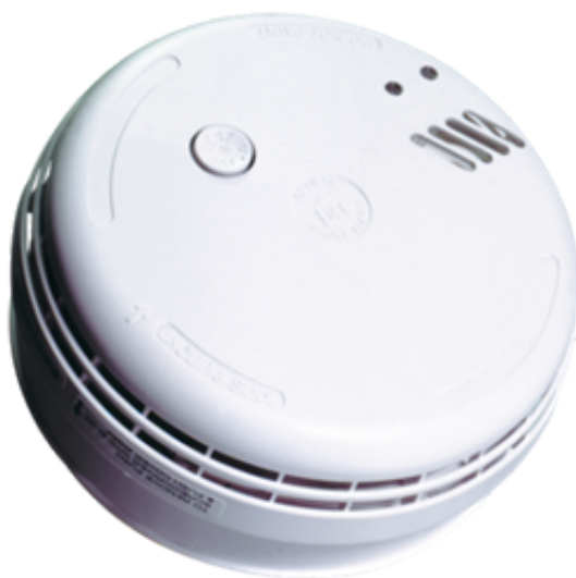
Afb. 3. Rookmelder