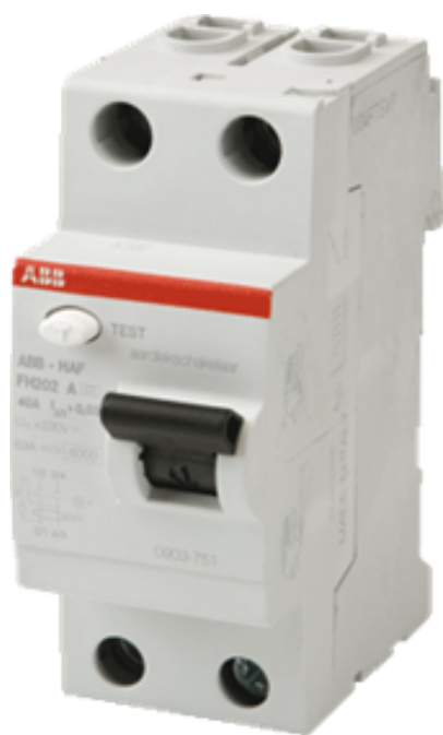
Afb. 2. Aardlekschakelaar