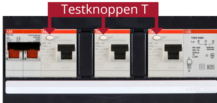
Afb. 6. Testknoppen