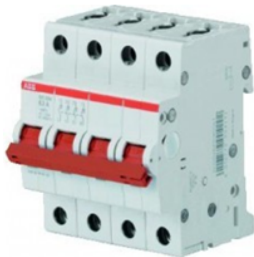
Afb. 4. Hoofdschakelaar

Om veilig aan de installatie te kunnen werken moet de 'hoofdschakelaar' (Afb. 4) uitgeschakeld worden.